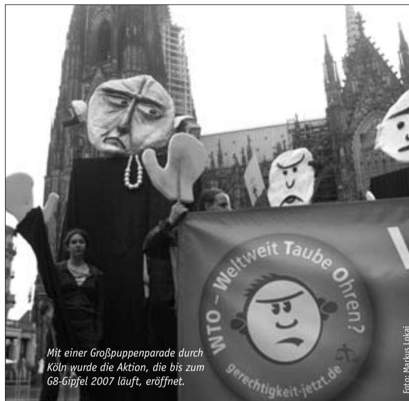
Mit einer Großpuppenparade durch Köln wurde die Aktion, die bis zum G8-Gipfel 2007 läuft, eröffnet.

„Ich entdecke für mich eine ganz neue Aktionsform.“ Wie Puppen für Gerechtigkeit mobilisieren