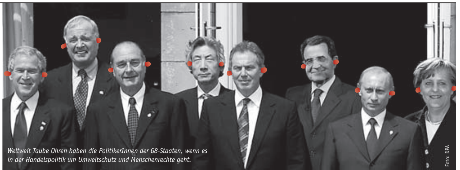
Weltweit Taube Ohren haben die PolitikerInnen der G8-Staaten, wenn es in der Handelspolitik um Umweltschutz und Menschenrechte geht.

Das erste Aktionswochenende findet vom 13.-15. Oktober statt. Das Team von Gerechtigkeit jetzt! unterstützt Sie gerne: Mit Tipps, wer vor Ort schon aktiv ist, mit Ideen für Aktionen und mit Beratung für die Pressearbeit: 0228 – 368 10 10.