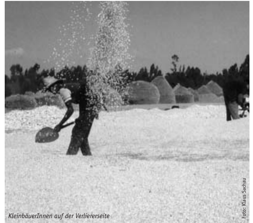
KleinbäuerInnen auf der Verliererseite

Die in vielen Bereichen anzutreffenden quasi-monopolistischen Strukturen widersprechen nicht nur den theoretischen Annahmen von effizienten Märkten und freiem Wettbewerb, sie wirken